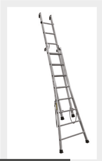
EN POSITION APPUI