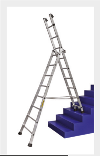
EN POSITION ESCALIER

STABILITE HORS PAIR GRACE A SA BASE EVASEE