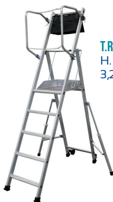
T.REX - 5 MARCHES H. travail maxi : 3,20 m