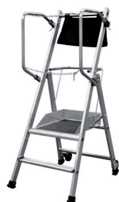
T.REX - 2 MARCHES H. travail maxi : 2,50 m