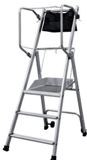
T.REX - 3 MARCHES H. travail maxi : 2,70 m